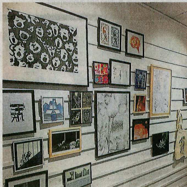
Deux créathèques ont été inaugurées au lycée Benjamin-Franklin et au collège Le Verger. L'objectif est d'encourager et de sensibiliser la créativité des élèves.