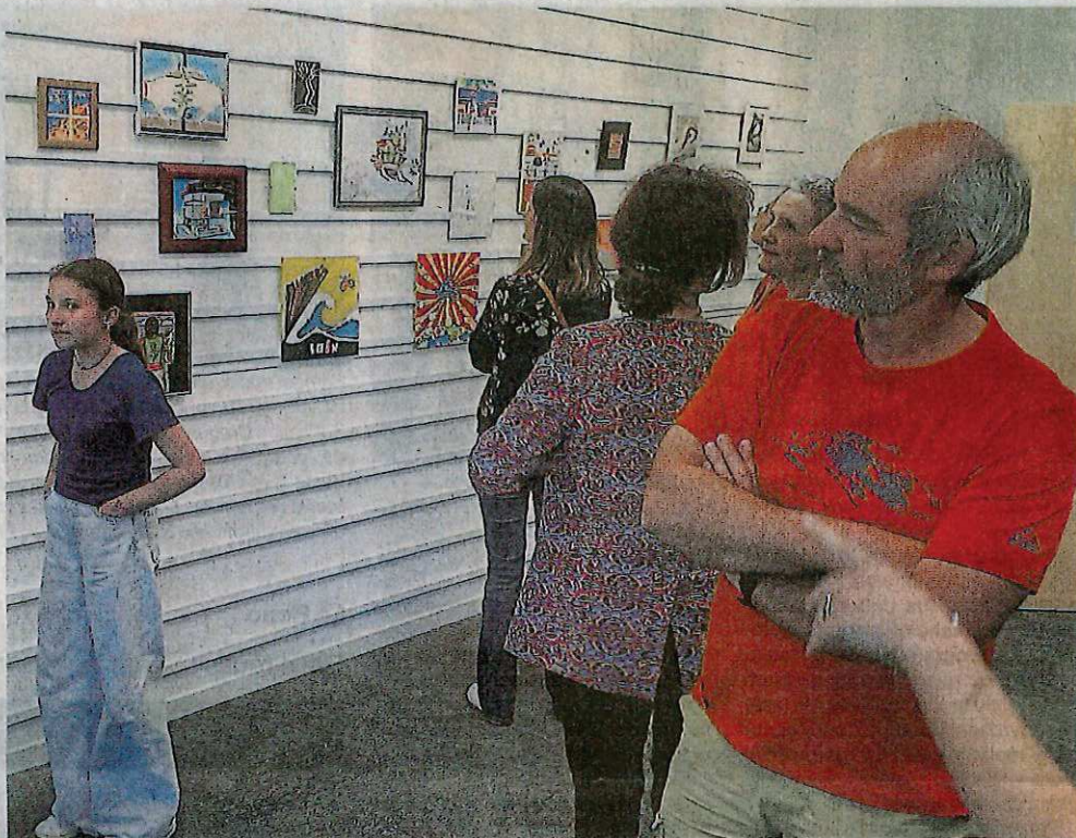
L'expression artistique au collège Le Verger se concrétise par la création d'une créathèque et d'une galerie d'art.

À Franklin, les travaux sont « présentés dans un meuble dédié », également au CDI, le projet étant porté à la fois par les enseignants en arts